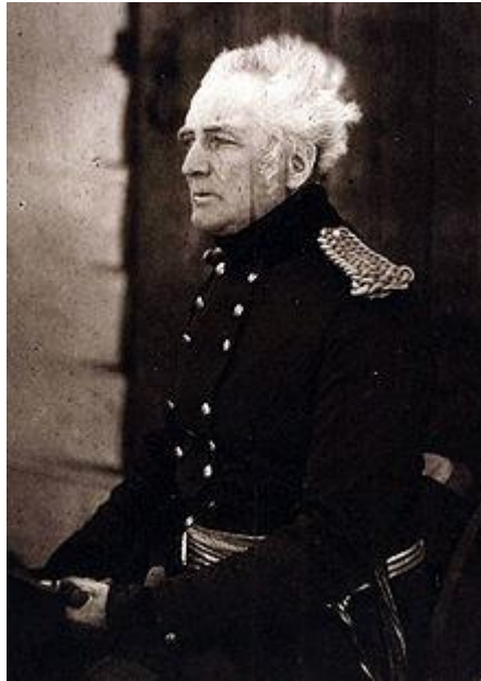
Sir George Brown, photographié par Roger Fenton en Crimée en 1855