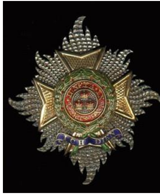
Ordre du Bain

Fondé en 1399 par Henri IV, renouvelé en 1725 par Georges I er , modifié en 1815 par Georges III et le 24 mai 1847 par la Reine Victoria. Il a pour objet de récompenser les mérites civils et militaires. Il existe deux catégories de membres : les Titulaires, tous Anglais et en nombre limité, les Honoraires, tous étrangers et en nombre illimité. Il existe deux séries : les civils et les militaires.