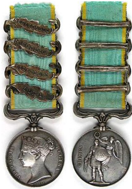
Avers et revers de la médaille de Crimée

quitta alors la Grande-Bretagne et devint un Ordre exclusivement attaché à cette ville, perdant ainsi son aspect britannique.