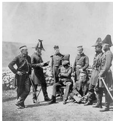
Général Brown et son personnel en Crimée.

Général Sir George Brown GCB = chevalier grand-croix de l'ordre du Bain , KH = chevalier de l'ordre des Guelfes , PC= conseil privé d'Irlande (3 Juillet 1790-27 Août 1865), était un soldat britannique qui a participé aux guerres d' Espagne et de Crimée .